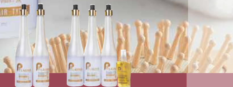
PLASMA S & C